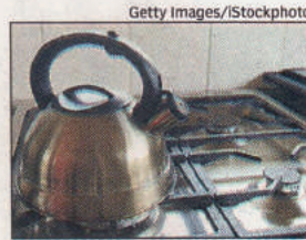
POWER TO THE KITCHEN

vert glycerol, vegetable oil or even biomass into LPG is present already but yet to mature," he added.